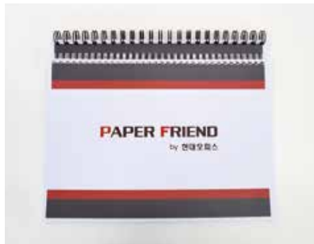
6. 제본완성! 제본이 끝난 후 왼쪽 파지함을 비워주세요.