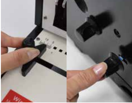
1. 3:1와이어링 페이퍼가이드를 용지크기에 맞추고 앞쪽의 천공마진 조절레버를 이용해 원하는 마진으로 조절합니다.