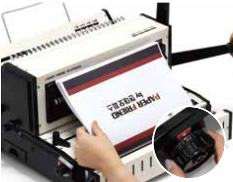
5. 와이어링 조절레버를 링사이즈에 맞춘 후 원고를 압착 홈에 넣고 제본핸들을 내려 링을 압착합니다.