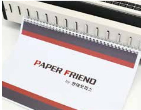
4. 와이어링걸이에 와이어링을 걸어준 후 천공된 종이를 끼워줍니다.