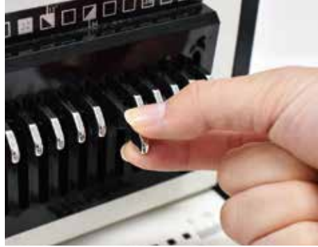
2. A4제본시 35번째 핀을 앞으로 빼내어 용지 끝부분에 반절구멍이 생기지 않도록 합니다.