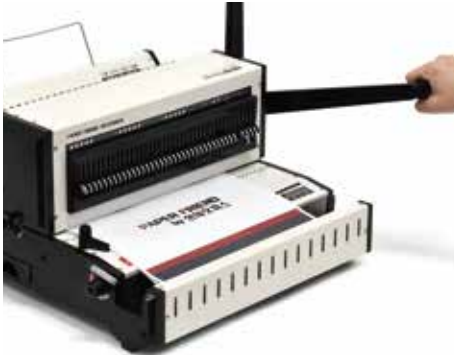
3. 천공할 원고를 정리하여 앞쪽 문서투입구에 넣고 천공핸들을 앞으로 내려 천공합니다.